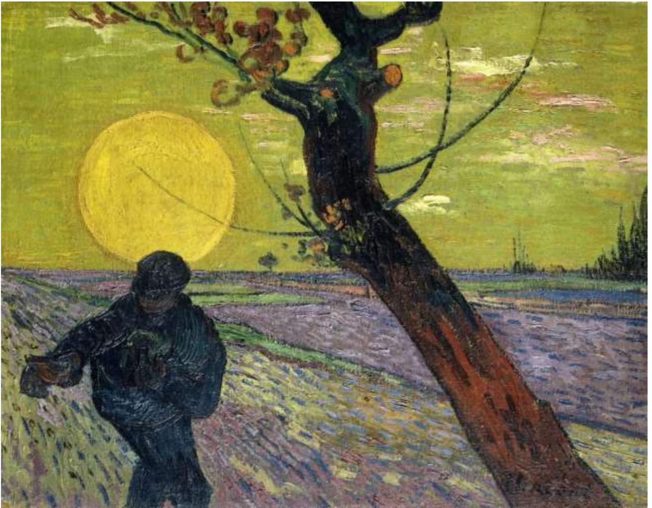
Le semeur, Van Gogh, 1888, Collection Bührle, Zürich (Suisse).