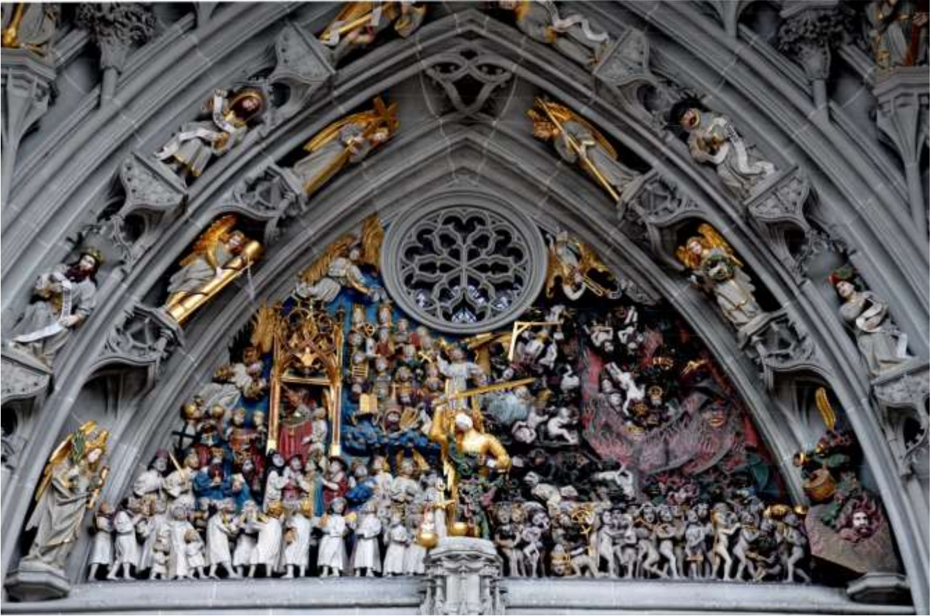
Jugement dernier, portail principal, Münster Berne (Suisse)