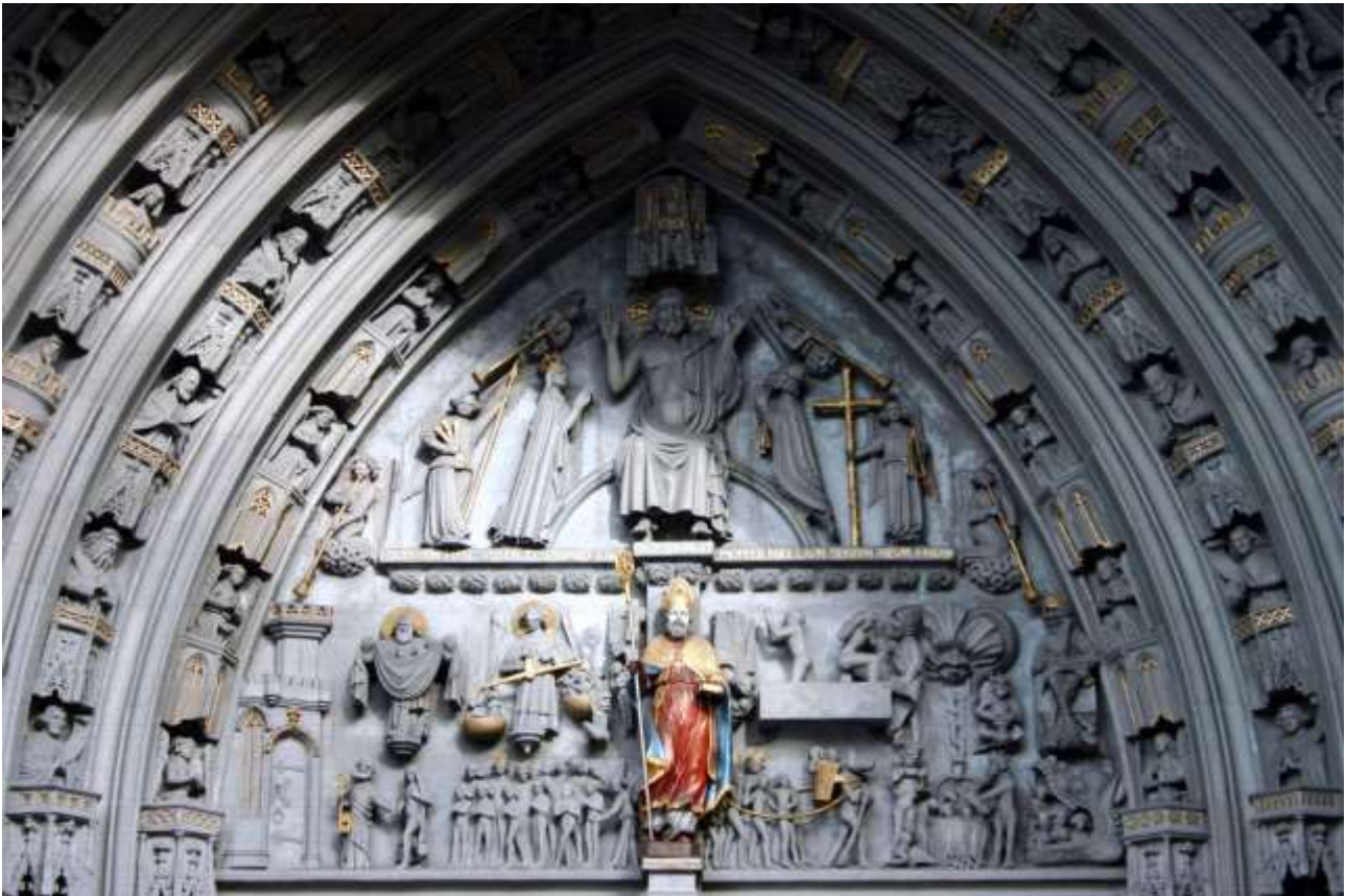
Jugement dernier, Portail principal, cathédrale St Nicolas, Fribourg.

Dans la partie supérieure se tient le Christ montrant ses plaies, assis au centre en juge des vivants et des morts, surmonté d'un dais.