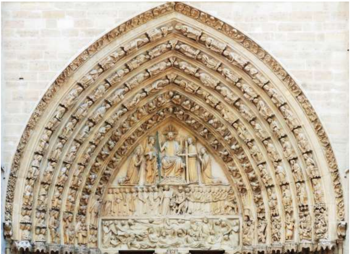
Jugement dernier, portail principal, cathédrale de Chartres (France)